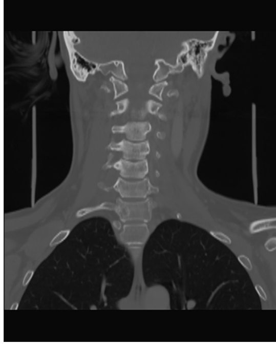
Şekil 2: Bilgisayarlı tomografide sağ tip3 servikal kosta görülmektedir.