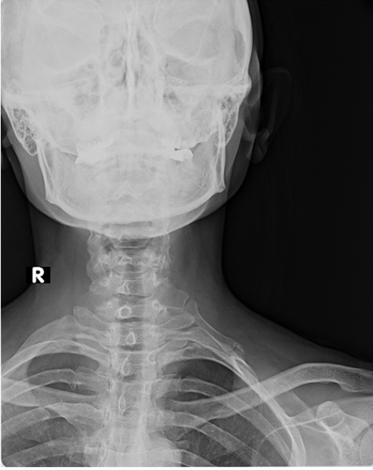
Şekil 1: Direkt radyografide sol tip4 servikal kosta görülmektedir.