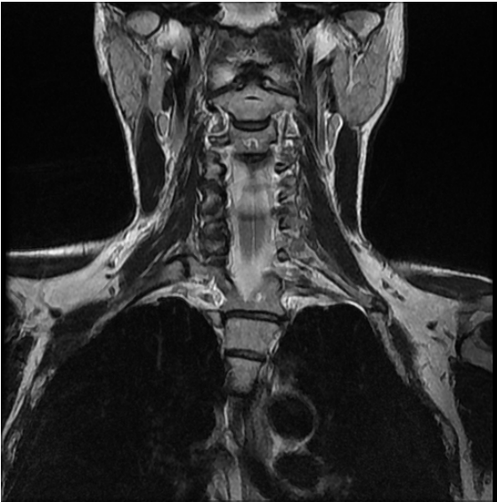
Şekil 3: Manyetik rezonans görüntülemesinde sol tip4 servikal kosta görülmektedir.