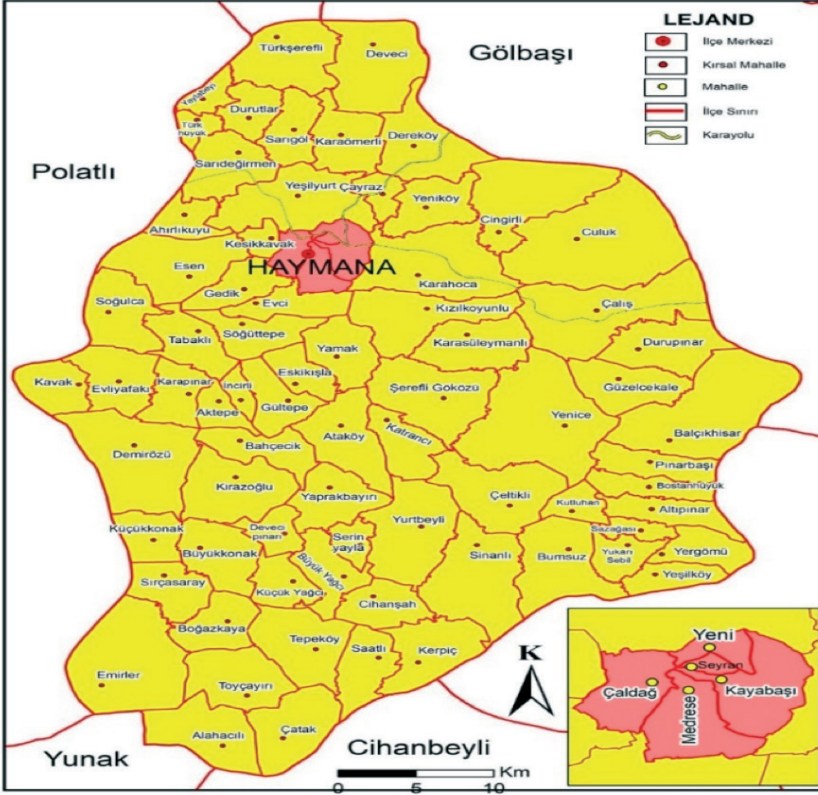
Şekil 4. Haymana Büyükşehir İlçesi Kırsal ve Kentsel Mahalleleri

Haymana ilçesinde 7254 Sayılı Kanun ile bu statüye kavuşan 73 kırsal mahalle mevcut olup, 2022 yılı itibariyle bu mahallelerin toplam nüfusu 18.404 kişidir (Şekil 4).