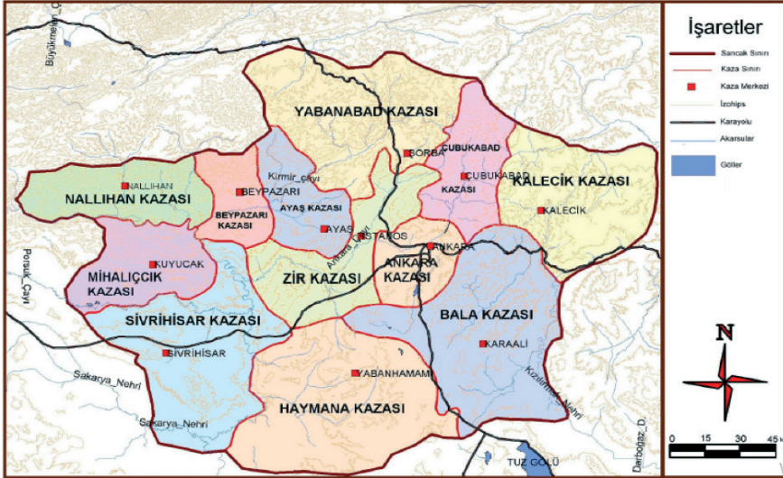
Şekil 3. 19. Yüzyıl Haymana Kazasının İdari Durumu

Sultan Abdülmecit zamanında çıkarılan Arazi Kanunnamesi (1858) ile devlet arazileri üzerinde özel mülkiyete izin verilmesi, tarım için kullanılan toprakların tasarruf edenin mülkiyetine geçmesi, konar-göçer aşiretlerin yerleşik hayata geçmesini kolaylaştırmış ve bu dönemde birçok konar-göçer aşiret Haymana'da eski yerleşimcilerin terk ettiği harap olmuş köylerin üzerine yerleşerek yeni köyler kurmuşlardır (Yurttaş, 2018). Haymana, 1882 yılında II. Abdülhamid zamanında idari bir merkez haline getirilmiştir. Haymana'nın günümüz idari merkezi olan mevkiinin belirlenip imar ve iskana açılması (hükümet konağı, okul, cami, sağlık çalışanları, telgraf hattının çekilmesi ile posta ağının kurulması, beledi teşkilatı) Kırım ve Kafkaslardaki gelişmeler sonrasında Anadolu'ya göç eden Müslüman muhacirlerin Haymana'daki boş uygun tarım arazilerine yerleştirilerek buraları yurt edinmeleri ve tarımsal faaliyetlere başlamalarıyla birlikte 1860-1910 yılları arasında olmuştur (Çevik Azap, 2018). XIX. yüzyılda Haymana kazası, doğudan Bâla, batıdan Sivrihisar, kuzeyden Zir ve güneyden Konya vilayetine bağlı olan Akşehir kazası ile çevrelenmekteydi (Şekil 3).