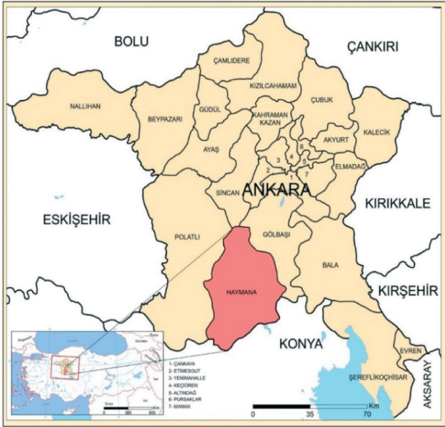
Şekil 2. Haymana İlçesinin Lokasyon Haritası

Osmanlı Devleti'nin yükselme devrinde (XVI. yüzyıl) Ankara sancağı merkez kazanın dışında Ayaş, Bacı, Çubuk, Murtazaâbâd ve Yabanabâd (Kızılcahamam) olmak üzere toplam beş kazadan oluşmaktaydı. Bu dönemde Haymana, Ankara'nın güney kesiminde konar-göçer yurdu olarak bilinmektedir. Sancağının önemli iskân sahalarından olan bu bölgede Ankara yürükleri arasında gerek nüfus gerekse cemaat sayısı bakımından en kalabalık konar-göçer teşekkülü olan Haymana taifeleri yaşamaktaydı (Tablo 1). Haymana taifesi genel olarak Haymana platosunun kıyı kesimleri boyunca dağılmış vaziyette idi (Turan, 1999; Erdoğan, 2004).