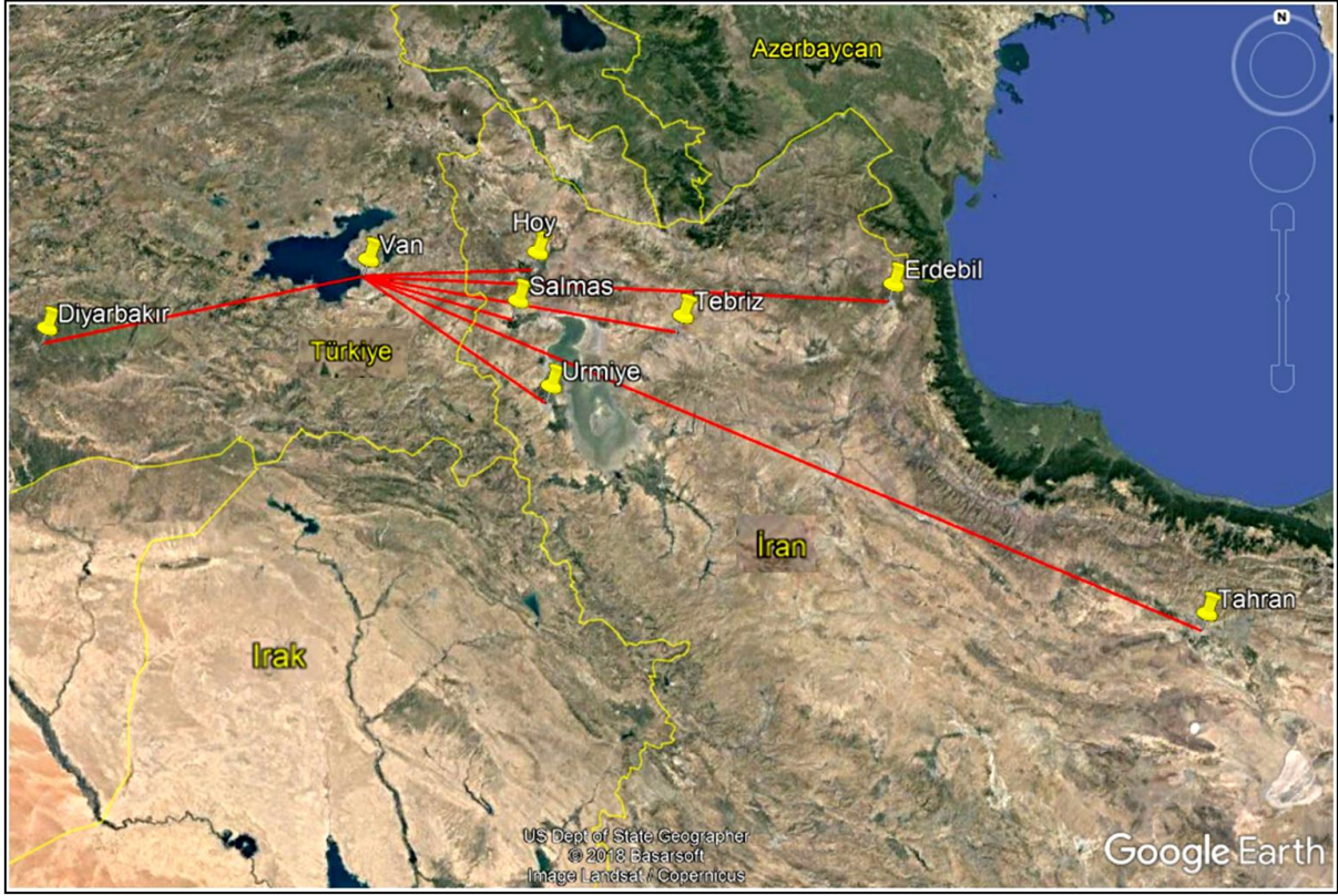
Harita 1: Bölgedeki Önemli Merkezlere Göre Van'ın Konumu (Google Earth, 2019)

Nevruz Bayramı'nda düzenlenen Van Alışveriş Festivali'nin kentin otel, yiyecek içecek işletmesi, eğlence merkezi gibi turistik arz kaynaklarında da önemli bir artış sağladığı görülmektedir. Konaklama tesisi bakımından 2014 yılına göre önemli derecede kapasite artışı görülmektedir. Örneğin, 2014 yılında 2 yıldızlı 2 adet, 3 yıldızlı 3 adet ve apart otel sayısı da 1 adet iken 2019 yılında 2 yıldızlı otel sayısı 3 adete, 3 yıldızlı otel sayısı 7 adete ve apart otel sayısı da 3 adete yükselmiştir (KTB, 2019). Bu rakamlar, Nevruz Bayramı döneminde düzenlenen alışveriş festivalinin ne derece turizm hareketi yarattığını, bununla beraber festivalin kentin gelişiminde ve tanıtımında ne derece önemli rol oynadığını gözler önüne sermektedir. Bununla beraber turizm ile ilişkili diğer sektörlerle de (inşaat, hazır giyim, hediyeleş eşya, gıda gibi) katma değer oluşturduğu bilinmektedir. Bu dönemde Van'a gelen yabancı turistlere sadece alışveriş ürünleri sunulmamakta aynı zamanda Nevruz Bayramı ritüelleri de (Fotoğraf 2) festival boyunca sergilenmektedir (Van Valiliği, 2019). Dolayısıyla bu gelenek hem Van'da yaşayan yerel halk tarafından hem de İran'dan gelen yabancı turistler tarafından yaşatılmakta ve tanıtılmaktadır. Bu da Nevruz Bayramı geleneğinin sürdürülebilirliği açısından oldukça önemlidir.