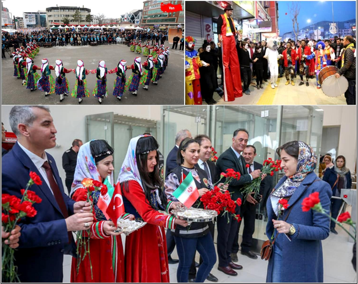
Fotoğraf 2: Van Alışveriş Festivali ve Nevruz Kutlamaları (Van Valiliği, 2019; Van TSO, 2017; Milliyet, 2019)

Kazakistan açısından Nevruz Bayramı'nın festival turizmi kapsamında değerlendirilmesi hususunda, Türkiye'nin Van iline benzer bir şekilde öne çıkarılabilecek destinasyon, Çimkent şehridir. Çimkent, 1 Nisan 2019 tarihi itibarıyla 1.014.013 kişilik nüfusuyla Kazakistan'ın Almatı ve Nursultan (Astana)'dan sonra üçüncü büyük şehridir (Kazakistan Cumhuriyeti İstatistik Ajansı, 2019). Çimkent'e Haziran 2018'de Kazakistan Cumhurbaşkanı Nursultan Nazarbayev tarafından büyükşehir statüsü verilmiştir. Bunun gerekçesi olarak Çimkent'in artan nüfusu, Orta Asya bölgesinin yatırımlar, teknolojiler ve entelektüel kaynakları için yeni bir merkez niteliği taşıması ve şehrin sosyo-ekonomik dengesi ile bölgedeki halkın yaşam kalitesinin artırılması için sürdürülebilir ivme kazandıracağı planlanması gösterilebilir (Anadolu Ajansı 2018). Çimkent şehri ulaşım olanakları açısından oldukça gelişmiştir. Kent, Taşkent-Bişkek-Almatı ve Taşkent-Nursultan (Astana) karayolları üzerinde kavşak noktası ve yine Taşkent-Almatı, Taşkent-Nursultan, Taşkent-Kazan demiryolları üzerinde önemli bir istasyon konumundadır. "Çimkent Uluslararası Havalimanı" da kentin hem Kazakistan'ın diğer şehirleriyle hem de dünyanın önemli metropollerine bağlantı kurmasını sağlamaktadır (Google Maps, 2019).