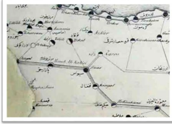
Harita 1. Carte Telegraphique de L'empire Ottoman 1874